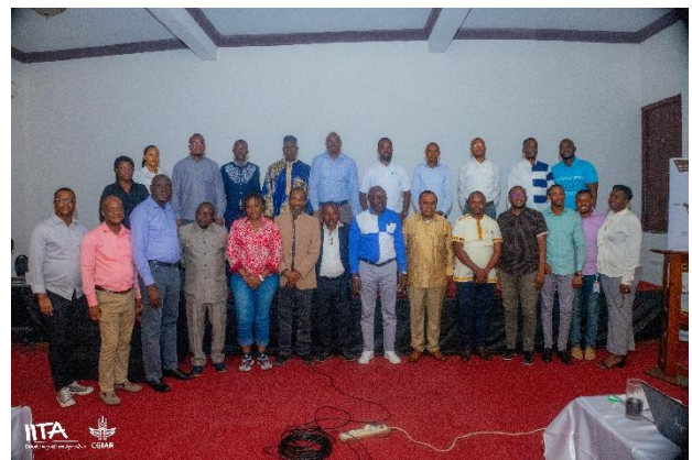
Les participants lors de la réunion annuelle du projet BBEST en RDC