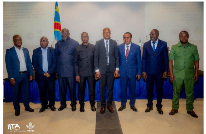
Photo de groupe des participants lors de la cérémonie de lancement du projet BBEST en RDC